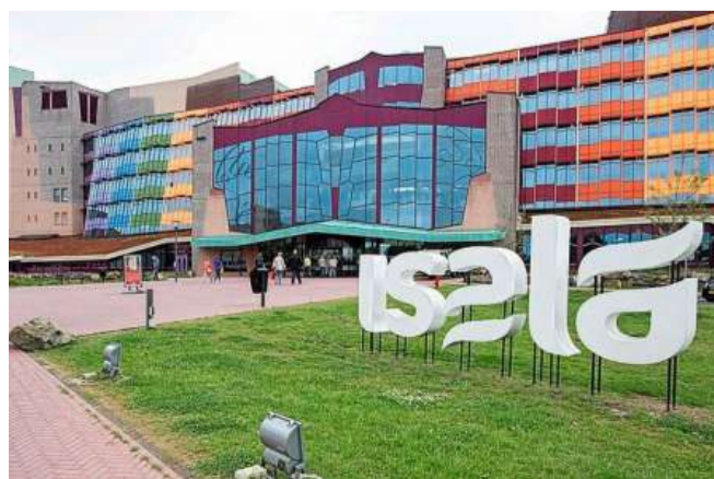
Het Isala-ziekenhuis in Zwolle moest afgelopen weekend twintig operaties van reguliere inhaalzorg afzeggen.

De klacht van niet-gevaccineerden is soms weliswaar dat de maatschappij hen met die codes buitensluit, vervolgt Verweij. „Maar door te laten zien dat we zorgbehoevenden niet laten vallen ongeacht hun vaccinatiekeuze, maken we duidelijk dat zij niet door ons worden buitengesloten. Daarmee voeren we de polarisatie niet naar het uiterste en blijft de deur open om nog wat mensen te overtuigen zich te laten vaccineren.”