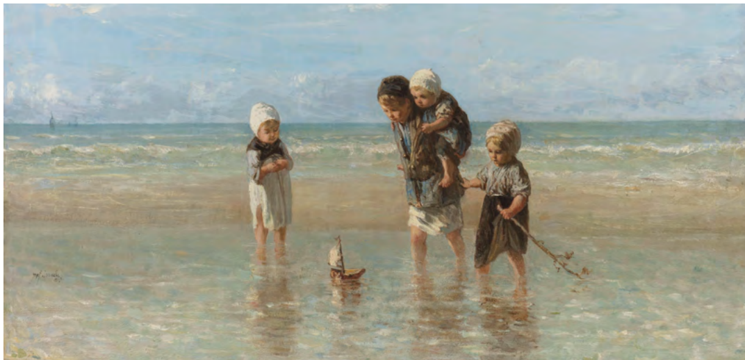
Kinderen der Zee door Joseph Israëls (1863) | Rijksmuseum

Liberale Reflecties is een uitgave van de Prof.mr. B.M. TeldersStichting.