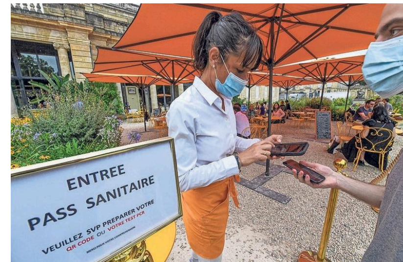
In Frankrijk zijn bezoekers van bijvoorbeeld een restaurant al gewend aan de coronacheck via een QR-code.

Augustus was een mindere maand dan juli, maar dat had ook met het slechtere weer te maken, en het feit dat er minder buitenlandse